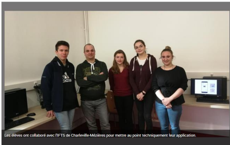
Les élèves ont collaboré avec l'IFTS de Charleville-Mézières pour mettre au point techniquement leur application.

Le jeudi 15 mars au ministère de l'Enseignement supérieur, de la recherche et de l'innovation , deux équipes de quatre élèves carolos vont défendre, devant un jury, leurs projets sélectionnés pour la finale du concours Science Factor et auront même le privilège de rencontrer la ministre Frédérique Vidal . Ce concours vise à faire émerger des idées et projets d'innovation citoyens, avec une participation égale de filles et de garçons, en prenant appui sur les réseaux sociaux. Science Factor propose aux élèves de la 6e à la terminale de construire en équipe un projet scientifique ou technique innovant, une invention ayant un impact positif clairement démontré au niveau sociétal, économique ou environnemental.